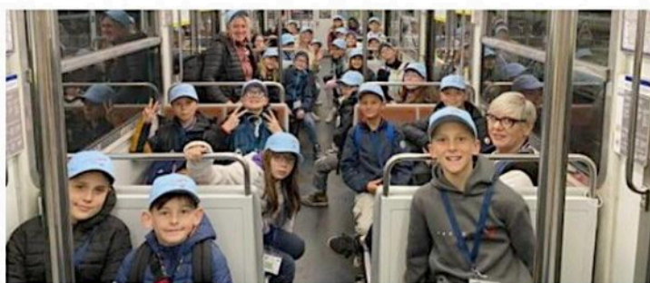
Expérience du métro, un véritable symbole de la vie urbaine.

Les 25 élèves de CM1-CM2 de l'école Couleurs d'avenir ont eu la chance de vivre un voyage scolaire exceptionnel à Paris. Ce projet pédagogique, validé par la DSDEN, a été conçu pour leur offrir une immersion enrichissante dans la culture, l'histoire et la vie urbaine de la capitale française. Un voyage dense mais surtout très qui leur a fait vivre une expérience qui reste-