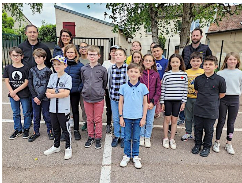
Ecole de Mont-sur-Meurthe

La défense et la promotion de la langue et de la culture française en France et à l'étranger sont effectivement au cœur des missions de l'association. Tous les ans, l'AMOPA encourage la jeunesse à participer au concours « Plaisir d'écrire » pour découvrir de jeunes talents littéraires et les distinguer lors de solennelles distributions de prix.