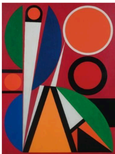
Orphée - 1957

Les diverses créations devront être retournées, par voie électronique – scan des créations – et par voie postale - au plus tard le 16 février 2024 .