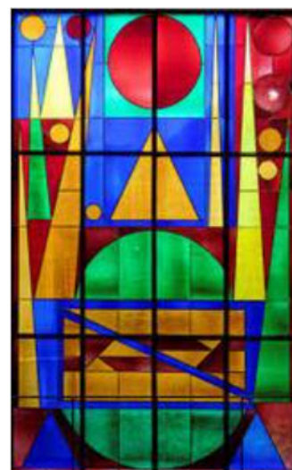
Joie - 1957

N'hésitez pas à visiter virtuellement le musée Matisse au Cateau Cambrésis , le musée d' art moderne à Cérét ,