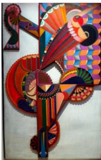
Danseuse - 1919