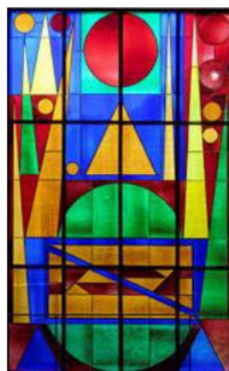
Joie- - 1957