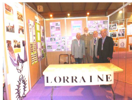
Les 4 Présidents Stand de Lorraine, visité par les amopaliens de Meurthe-et-Moselle